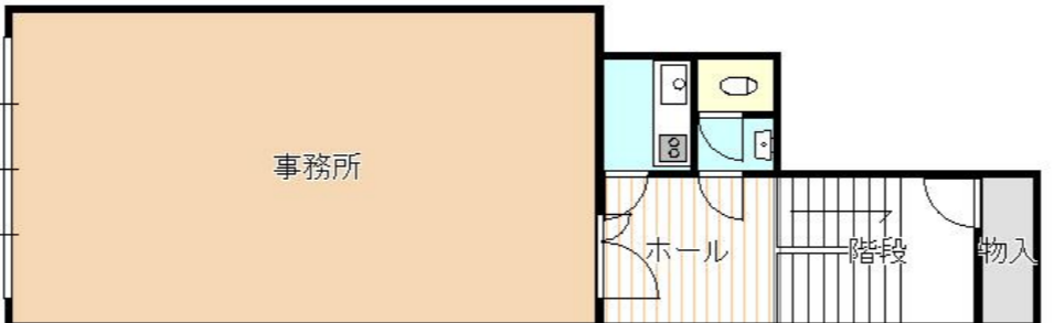
2・3階事務所 現況優先